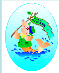
マスコットのあゆもどきち君

親子を対象とした、高島・旭竜地域の自然や歴史などを楽しみ、学び、守り育てる活動です。平成9年の春から、高島公民館と岡山市環境保全課、そして地元住民のグループ「高島・旭竜エコミュージアム」のメンバーが協力して進めてきました。 最初は身近な町とその自然を知ろうと、町や川・水辺、里山に出かけました。 まず、町中の史跡や水路などのポイントをまわって、それぞれの場所でクイズをするウォークラリーをしました。 春は川原の野草を観察しました。「食べられる野草」は天ぷら・あえ物・サラダにして「野の名産」も楽しみました。 夏は水辺。「魚取りの味覚」の指導で昔ながらの魚取りを体験しました。秋は里山へ。動物や植物を調べました。 冬は里山や里川へ。動物や植物の冬寝りや越冬を調べました。