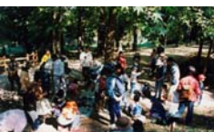
キノコ博士になろう