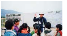
春を丸ごと食べよう