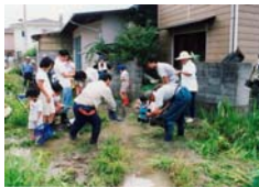
アユモドキの赤ちゃん見学会