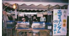
ホテル祭り 淡水魚ブース 協力：NPO岡山淡水魚研究会