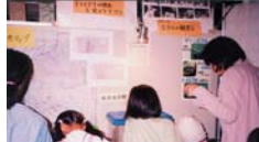
ホテル祭り ホテルブース