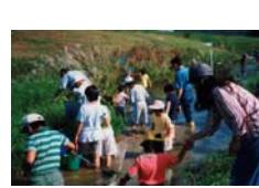
百間川水辺の教室